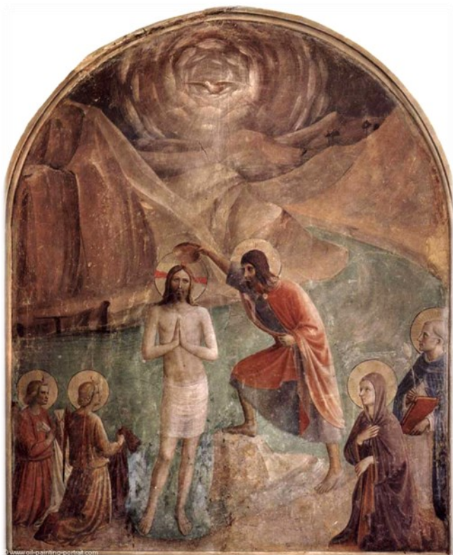
Fra Angelico , Taufe Christi durch Johannes

„Engel haben ihm assistiert, vom Himmel hallte der Donner, der Jordan wich angstvoll zurück und warf erregt seine Wasser empor, während die Gestirne ihre Huldigung darbrachten.“