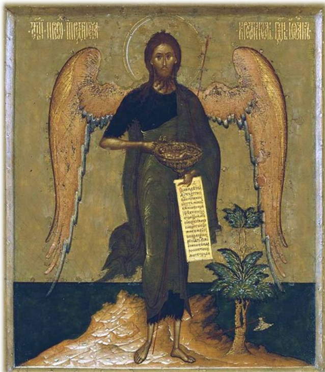
Russische Ikone, 1620

„Siehe, ich sende meinen Engel vor dir her“. Mit gewaltigen Flügeln wird der Täufer auf Ikonen dargestellt – ins Engelhafte reicht er hinauf.